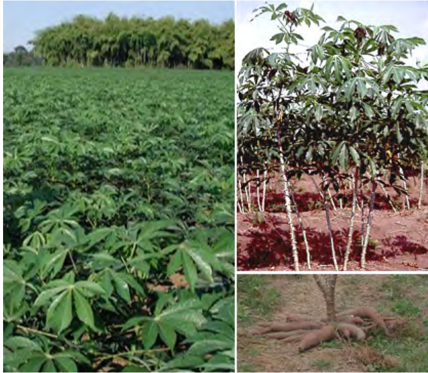
(写真)左：キャッサバ畑。右上：全体像、右下：収穫した芋